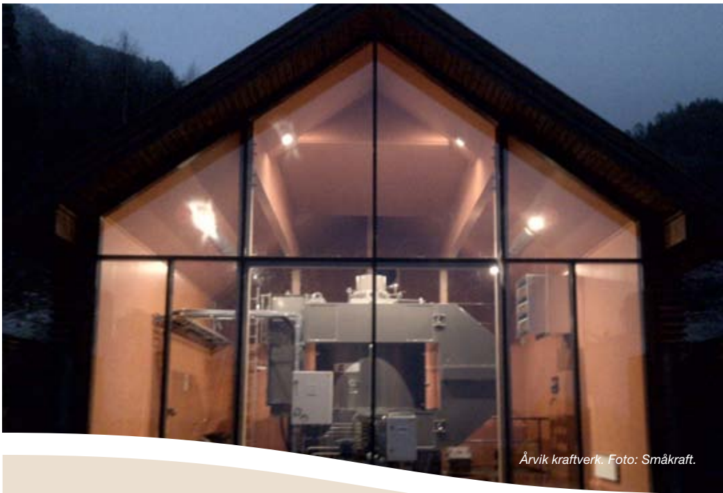
Årvik kraftverk.